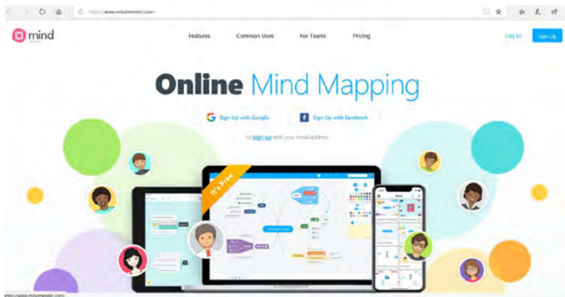
Rys 1 – Strona internetowa mindmeister.com